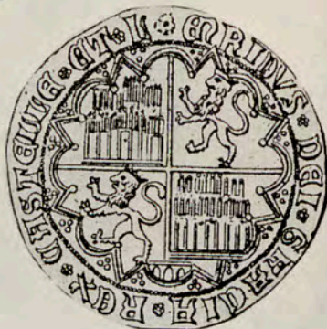
Lámina 5: 20 Veinte enriques de Segovia. 21 Cinco enriques de Segovia. 22 Cinco enriques de Burgos.